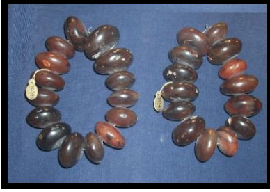
الشكل رقم (١٥) زوج من الأساور العقيق ، مقتنيات المتحف المصري بالقاهرة ، تحت رقم (٧٠٣٤٩ ، ٧٠٣٤٨) .