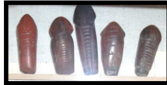
الشكل رقم (٩) أشكال متعددة من تميمة منقبت ، مقتنيات المتحف المصري بالقاهرة .

و فيما يلي تحليل لبعض مشغولات الفن المصري القديم المستخدم في تنفيذها العقيق الأحمر :