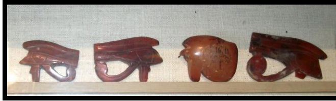
الشكل رقم (٦) مجموعة من الأوجات من العقيق الأحمر ، مقتنيات المتحف المصري بالقاهرة .

وتعبر عن القوة الملكية المستمدة من الآلهة حورس أو رع ، وتعد رمزاً شمسياً، والذي يجسد النظام والصرامة و الوضع المثالي . كانت تلك القلادة توضع أيضا على صدر مومياء فرعون لتحميته في القبر " ١٨ ، و تفنن الفنان المصري القديم في صناعة و تشكيل العديد من التماثيل بمختلف الأحجام و التي تحمل صورا لعين حورس.و تعرف أيضا بإسم الأوجات في المصرية القديمة و " كانت بمثابة رمز للإشارة إلي الإستقرار الكوني والدولي في عهد الفراعنة " ١٩ .