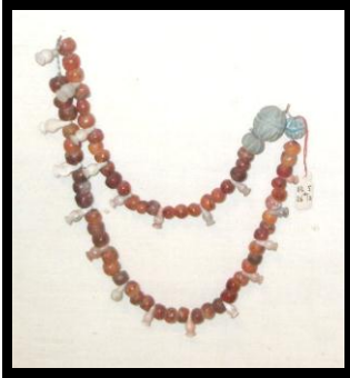
الشكل رقم (١٢) عقد من العقيق ، مقتنيات المتحف المصري بالقاهرة.

عقد من العقيق الأحمر يبلغ طوله حوالي ٦٠ سم ، و هو عبارة عن خرزات من العقيق الأحمر مستديرة و أخرى على شكل إناء مثقوب من أعلى ، حيث توضع سبعة خرزات مستديرة بالتبادل مع خرزه على شكل إناء على طول العقد .