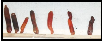
الشكل رقم (١٠) يوضح أشكال متعددة من تميمة الثعبان ، مقتنيات المتحف المصري بالقاهرة ، تصوير الباحثة.

موضوعة على حنجرته، فإن المعروف سوف يصنع من أجله كما هو من أجل التاسوع المقدس، وسيلحق بأتباع حورس. وسيتكون له سريعاً حشد من النجوم في مواجهة ذلك الذي يسكن النجمة سويد وسيصبح جسده ريانياً مع أتباعه إلى الأبد. ولقد كان جلالة تحوت هو الذي كون هذا لجلالة أوزوريس، وبذلك سيبقى الضوء على جسده. وهي تعويذة في الحقيقة ممتازة ثبتت فعاليتها مليون مرة ، كما أن تميمة منقت تضمن للمتوفى حصوله على ما يحتاجه من الجعة في العالم الآخر " ٢٦ ، و الشكل التالي يوضح أشكال متعددة من تميمة منقبت :