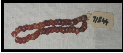
الشكل رقم (١٦) إسورة من العقيق ، مقتنيات المتحف المصري بالقاهرة ، تحت رقم (٧١٥٤٤) .

زوج من الأساور مصنوعة من العقيق الأحمر يبلغ طوله حوالي ٣٠ سم ، و هو عبارة عن خرزات كبيرة الحجم من العقيق الأحمر مثقوبة تلتصوم مع بعضها البعض في خيط قطنى .