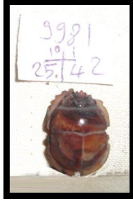
الشكل رقم (3) جعران من العقيق الأحمر ، مقتنيات المتحف المصري بالقاهرة تحت رقم (٩٩٨١) .

الرمز إعتباطاً ، " فحياة حشرة الجعران تشبة إلي حد كبير حياة الشمس فالمعروف أن أنثى الجعران عندما تبيض تدفن بيضتها في سرداب طويل في باطن الأرض ، و عندما تقفس بيضتها و يخرج منها جعران صغير ، تبدو الصورة و كأن الحياة تخرج من تراب ميت ، مثل الشمس التي عندما تغرب في المساء تعود في الصباح جديدة بيوم جديد . و لم يكتف المصري القديم بملاحظته عن حياة الجعران ، بل أطلق عليه إسم (خبرى) و هى كلمة معناها أن (يصبح) أو أن (يكون) ، و من هنا أصبح الجعران أهم رموز الشمس في مصر القديمة ١٧ .