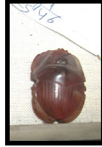
الشكل رقم (2) جعران من العقيق الأحمر ، مقتنيات المتحف المصري بالقاهرة تحت رقم (١٠٠٥١) ، تصوير الباحثة .