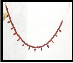
الشكل رقم (١١) عقد من العقيق ، مقتنيات المتحف المصري بالقاهرة ، تحت رقم (J.٩٢٦٤١).